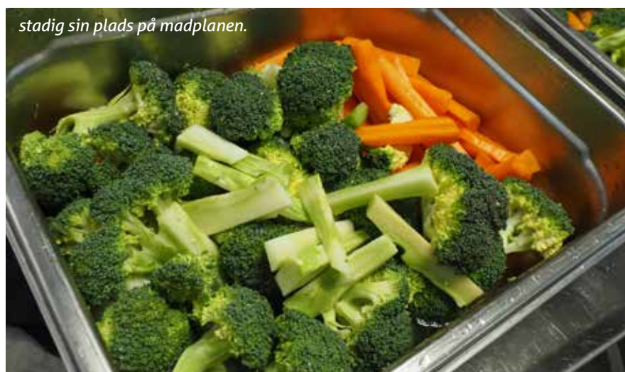
stadig sin plads på madplanen.