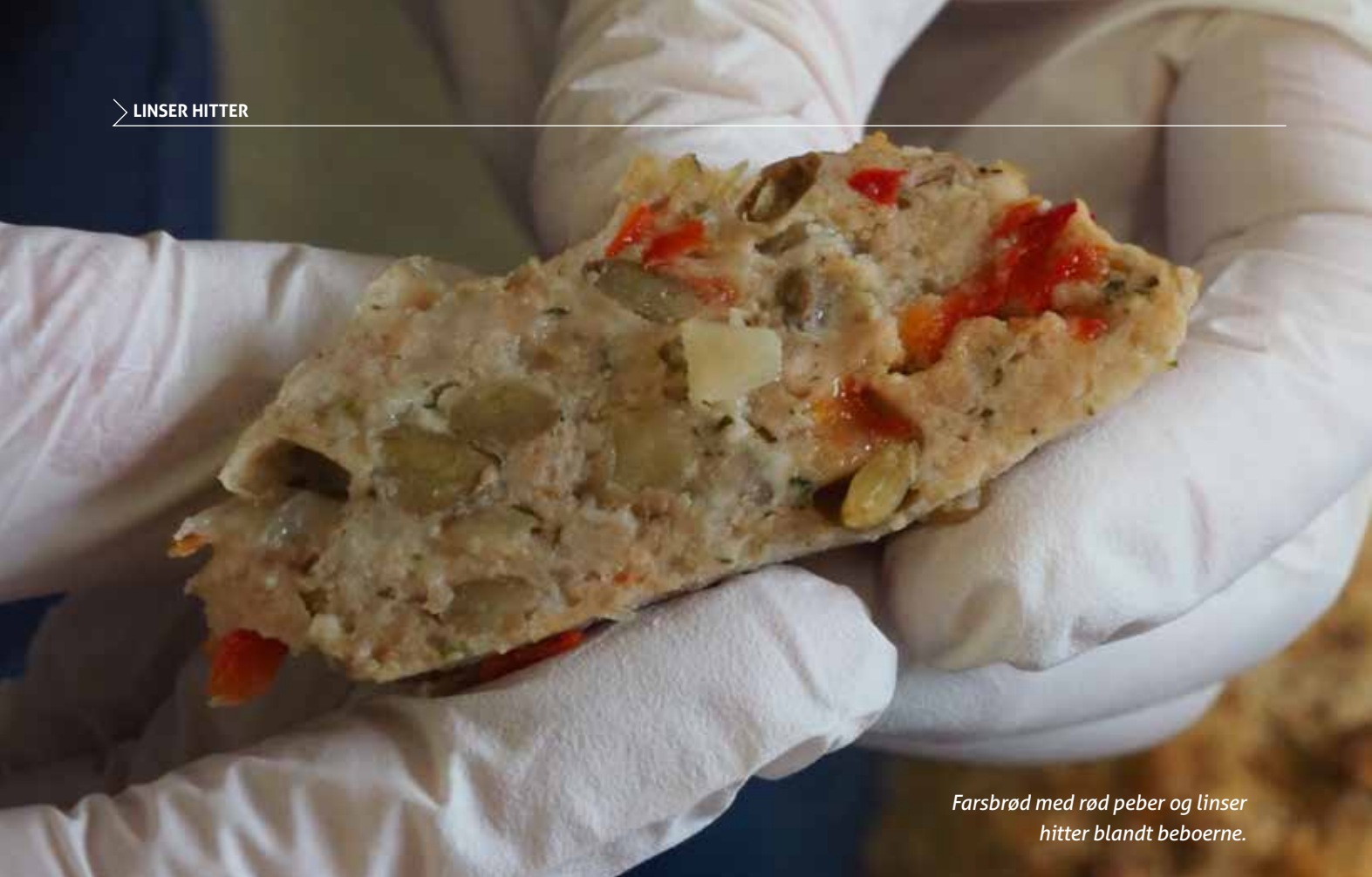
Farsbrød med rød peber og linser hitter blandt beboerne.