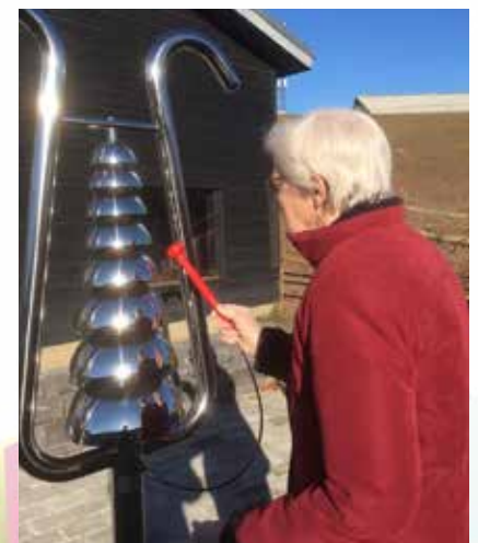
Bell-lyren er et af de instrumenter, som mange ældre har glæde af at spille på.

Og så tilbage til den himmerlandske muld: Et oldebarn drøner rundt, spiller på instrumenterne og konstaterer "Olfedar, nu er det ikke længere kedeligt at besøge dig".