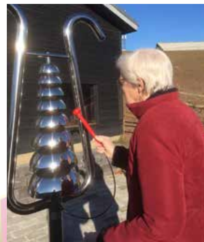
Bell-lyren er et af de instrumenter, som mange ældre har glæde af at spille på.

Og så tilbage til den himmerlandske muld: Et oldebarn drøner rundt, spiller på instrumenterne og konstaterer "Oldefar, nu er det ikke længere kedeligt at besøge dig".